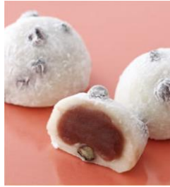
塩豆大福 216円 (税込)