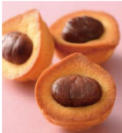
くりくり 216円 (税込)