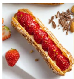
咲クレール アールグレイいちご 367円 (税込)