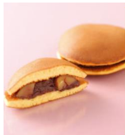
渋皮栗どら焼き 302円 (税込)